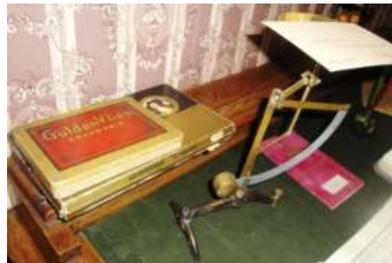
De brievenweger en sigarendoos