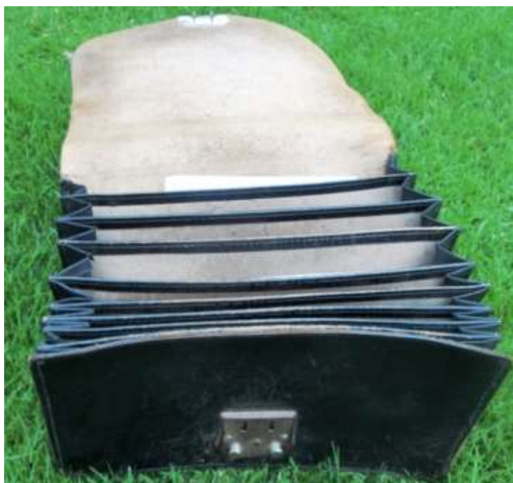
De Ripse geldtas