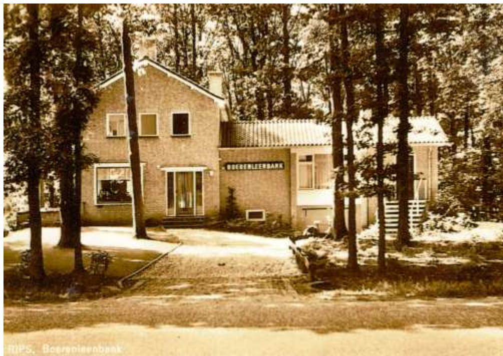
De nieuwe Boerenleenbank aan de Ripsestraat